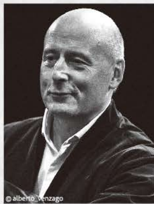
[音楽監督] パーヴォ・ヤルヴィ

ドイツ・グラモフォン専属アーティスト。ショパン・コンクールのライヴ録音を収録したファースト・アルバムはフレデリック賞を受賞し、グラモフォン誌のクリティクス・チョイスとエディターズ・チョイスのほか、2021年のベスト・クラシックアルバムに選出された。